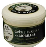
De la crème fraîche aux morilles pour la dégustation des fruits de mer