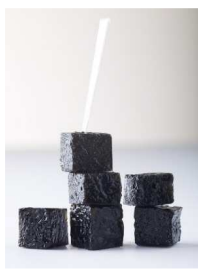
Du caviar en forme de cubes à poser sur des amuse-bouches