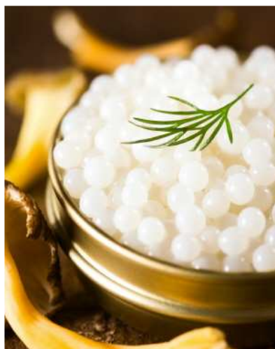
Du caviar d'escargot pour épater ses amis à Noël

(Relaxnews) - Outre les traditionnels foie gras et dindes, Noël est aussi l'occasion d'innover et de mettre sur la table de fête des aliments innovants et originaux. Artisans, spécialiste du caviar et boulangers proposent justement des recettes originales, idéales pour épater les amis au moment du repas. Voici cinq produits alimentaires pour composer un menu de Noël hors du commun.