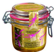
Un foie gras original avec des fruits croquants par les traiteurs Fauchon