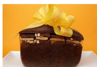
Un pain surprise de pain d'épices au foie gras